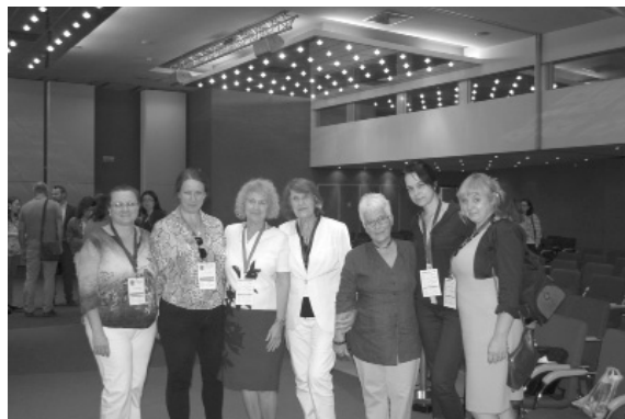
Цей спільний науковий захід й надалі сприятиме розширенню контактів на регіональному та європейському рівнях.