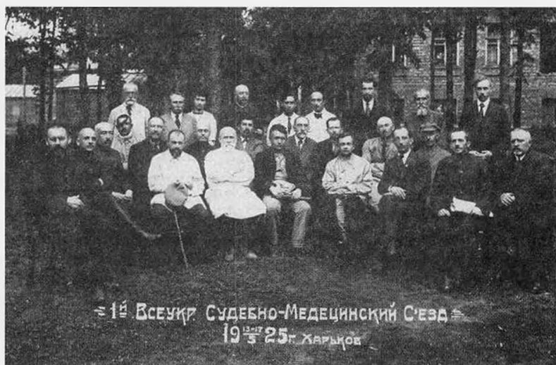
Мал.1. Делегати Першого Всеукраїнського судово-медичного з'їзду у м. Харкові, 1925 р. (в центрі (сидячи у медичному халаті) – Головний судово-медичний інспектор Наркомздора, Заслужений проф. Микола Сергійович Бокаріус)

Серед архівного матеріалу був знайдений історичний фотодокумент - оригінальна фотографія 1925 року, яка наочно демонструє факт проведення Першого Всеукраїнського судово-медичного з'їзду у м. Харкові (мал. 1).