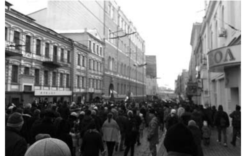
Хода, присвячена річниці Революції гідності

У лютому 2014 року під час сутичок протестувальників із силовиками в центрі Києва загинули понад 100 осіб, сотні були поранені, найбільше – 20 лютого. Згодом загиблих учасників акцій протесту почали називати «Небесною сотнею».